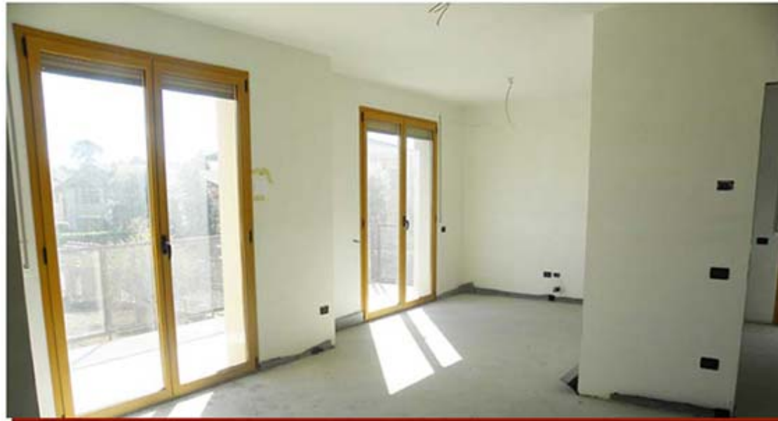
Residence "La Fontana" Roncola di Treviolo (BG)