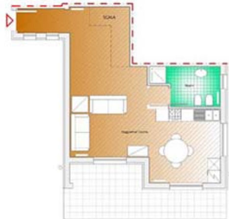
appartamento 8 - piano primo