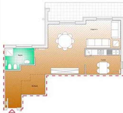
appartamento 6 - piano primo