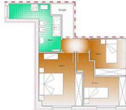
appartamento 8 - piano sottotetto