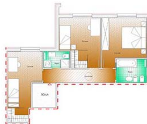
appartamento 6 - piano sottotetto