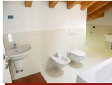
Residence "La Fontana" Roncola di Treviolo (BG)